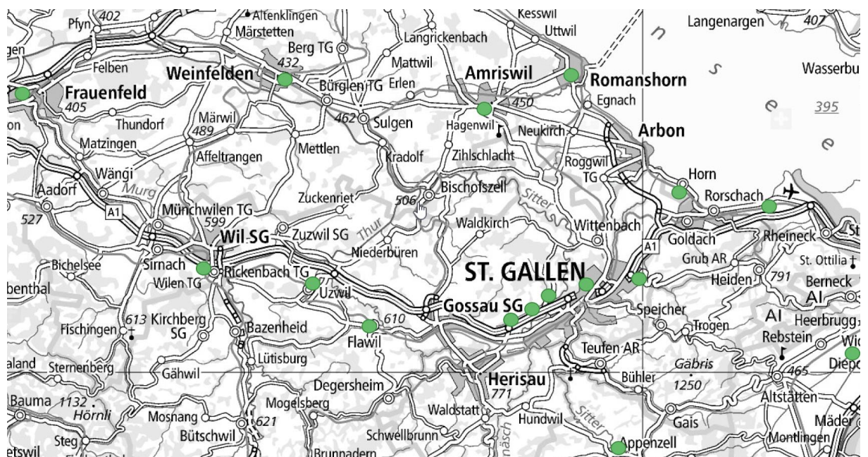
Abb. 2 Übersicht Tennishallen (bhateam ingenieure ag, 2020)